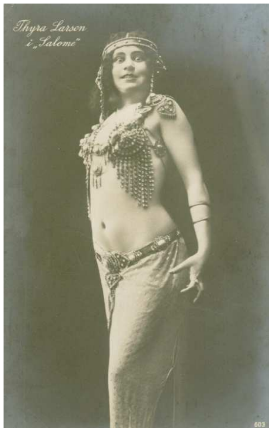
Thyra Larsen i "Salome" ca. 1911