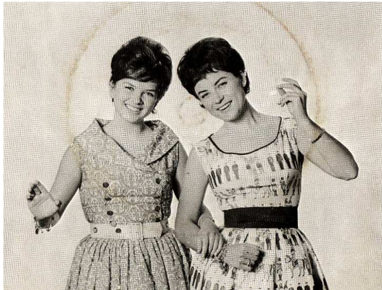
De to søstre