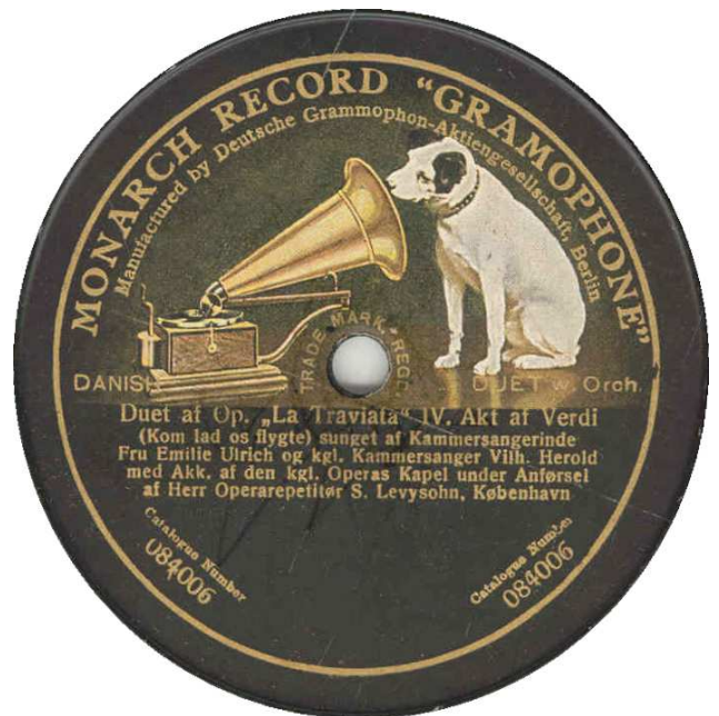
Monarch Record "Gramophone", Berlin. 084006 koblet med 084008