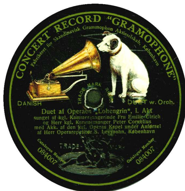
Berlin - København