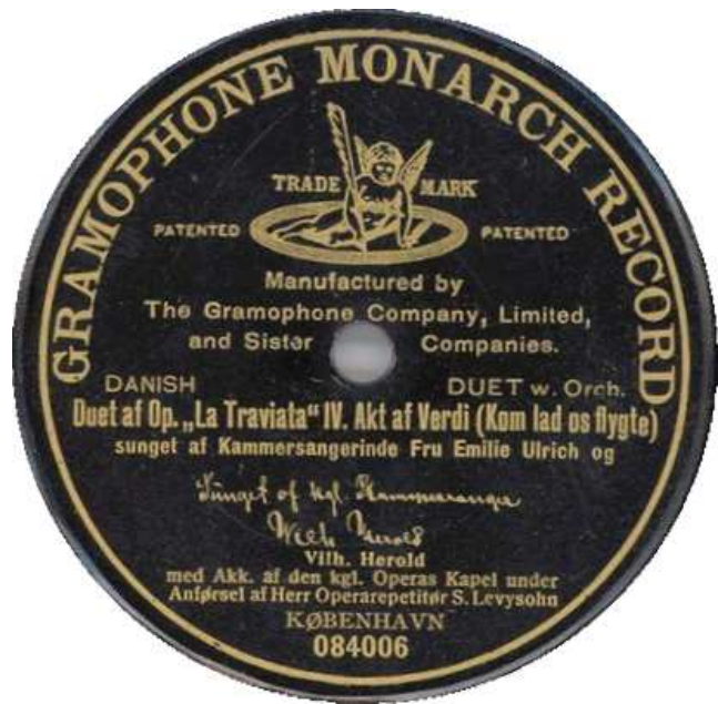
Gramophone Monarch Record – ES Pre-dog – 084006 – Vilhelm og Vilh. Scan th: Erik Høst