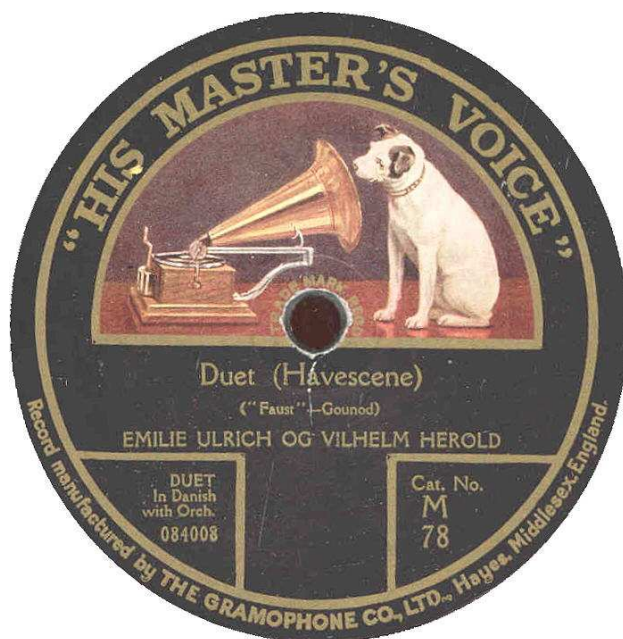
Concert Record "Gramophone" og HMV M 78.