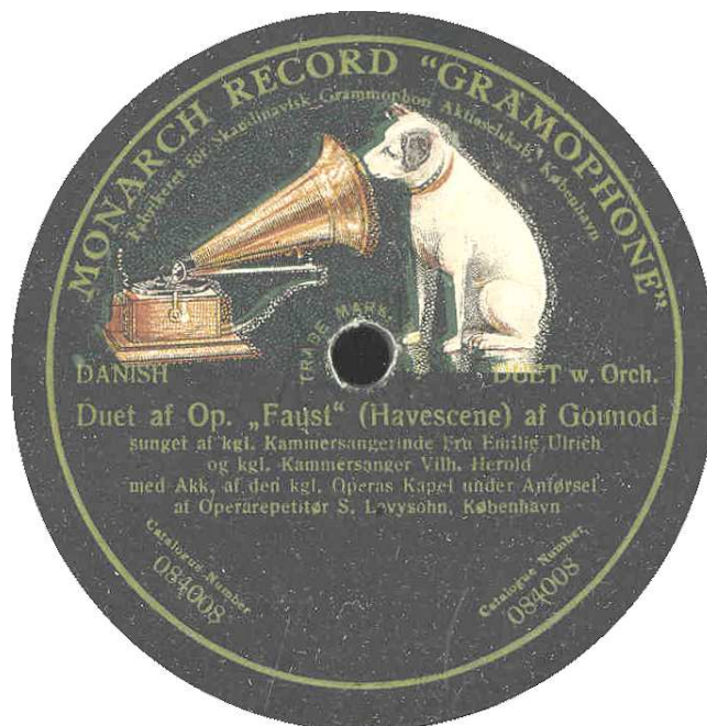
Monarch Record "Gramophone", København. 084008 koblet med 084006