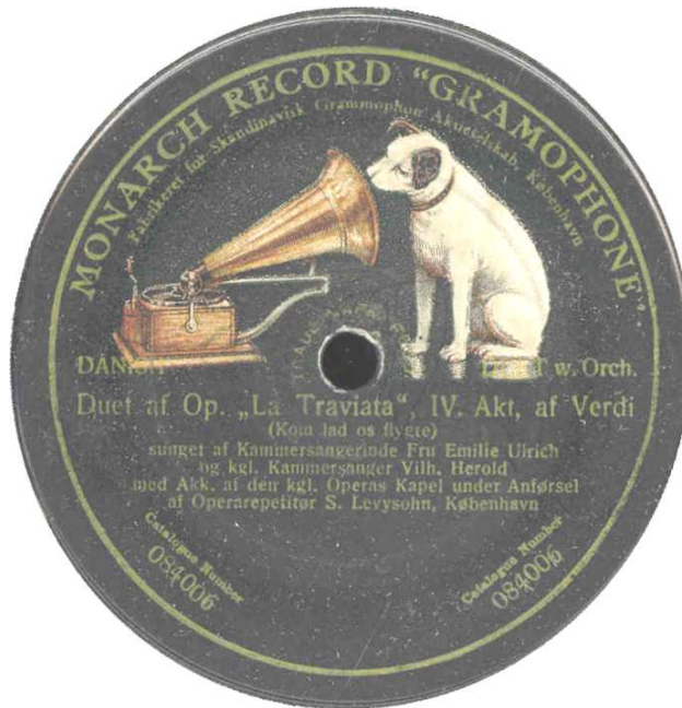
Monarch Record "Gramophone", København. 084006 koblet med 084008