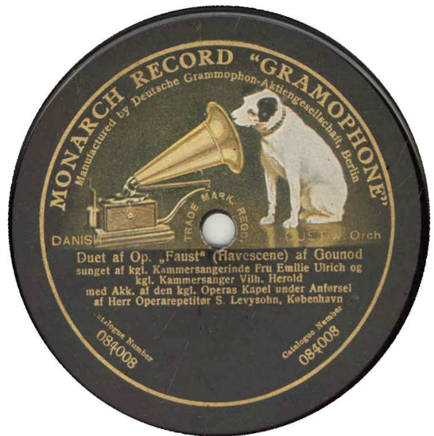
Monarch Record "Gramophone", Berlin. 084008 koblet med 084006