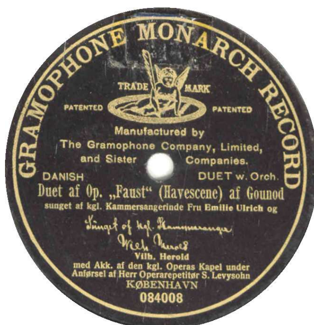
Gramophone Monarch Record, Enkelt-sided Pre-dog 084008