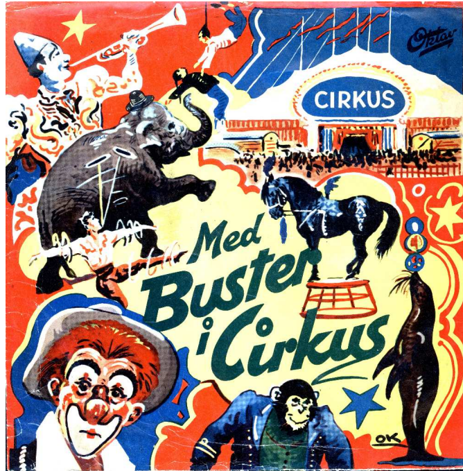
Coveret til Oktavs udgave.

Ikke meget vides om pladeselskabet Safir Records. Tilsyneladende udgav det kun disse tre plader – alle med fine covers. Pladeselskabet Oktav har også udsendt "Med Buster i Cirkus" (Oktav 78 OK 1023 matricenr. GO 38/39 og på vinyl Oktav 45 oks 1023 – DGS 47/48), så der må have været et sammenfald af en eller anden art mellem Safir og Oktav. (Også "Cirkus Buster" på Diplom single-plade. ca. 1958/59 - Diplom blev til Diplom/Oktav og siden bare Oktav. Det er formentlig samme optagelse, da det er de samme medvirkende. Polyphon har udsendt både en LP og en 45 omdr. med "Cirkus Buster".),