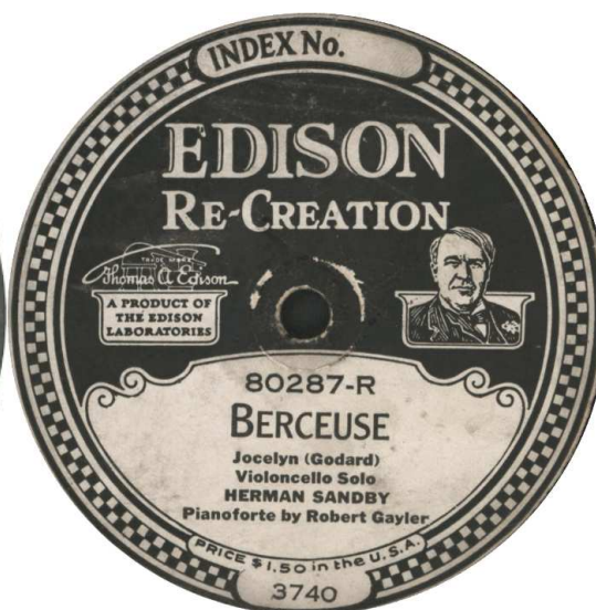
Take 3740B og Take 3740A