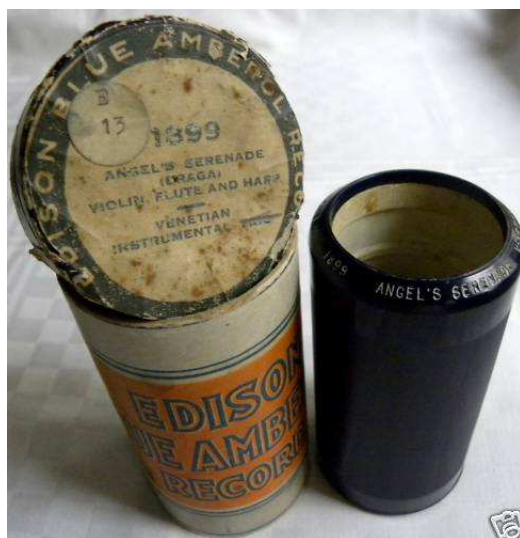
"Venetian Instrumental Trio" Måske er det Tollefsens Trio?