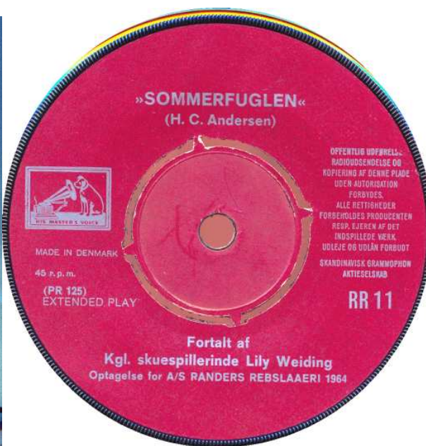
Cover og plade Scan th: Jan Mikkelsen

Optaget for Randers Rebslaeri i anledning af firmaets 125 års fødselsdag i 1965. I alt blev udsendt omkring en snes singleplader med sang, musik og oplæsning af Randers Rebslaeri. HMV stod for produktionen