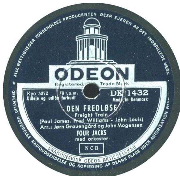
Senere oplag – med små ændringer i etiketterne