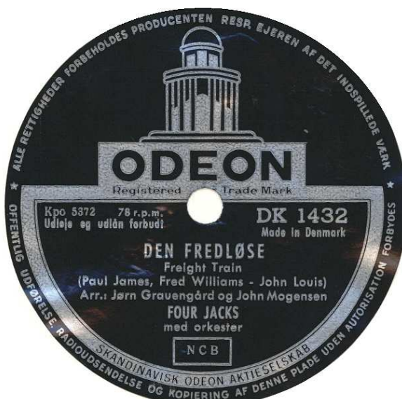
1. oplag uden Jørn Grauegård som tekstforfatter